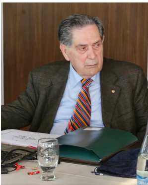
SILVANO MARSEGLIA (Italia) Presidente Europeo AEDE

In order to be more useful, AEDE, will strive to extend relations with the school reality as much as possible and to strengthen the communication systems, in order to be able to reach a greater number of users. The various members of the Presidential Council have put forward various proposals to promote and support awareness-raising initiatives to improve the level of skills.